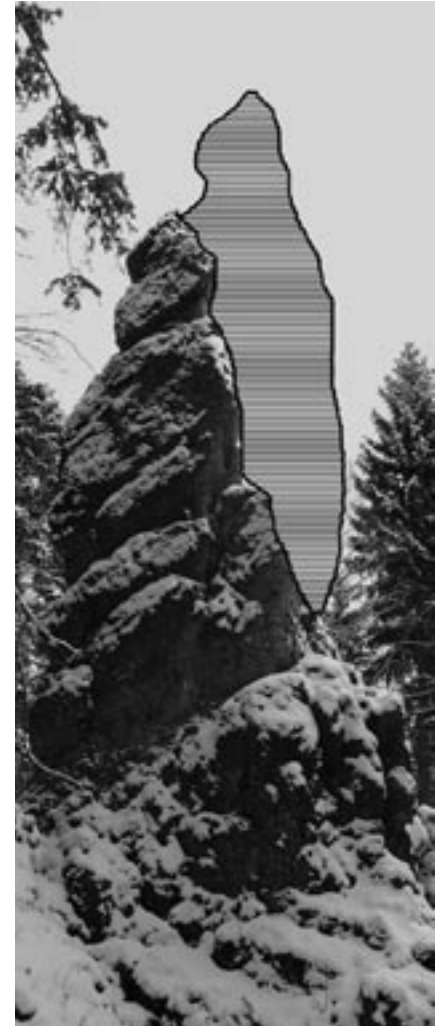
Links eine historische Aufnahme der Waldmannspitze, rechts eine aktuelle Aufnahme mit dem fehlenden Fels eingezeichnet.